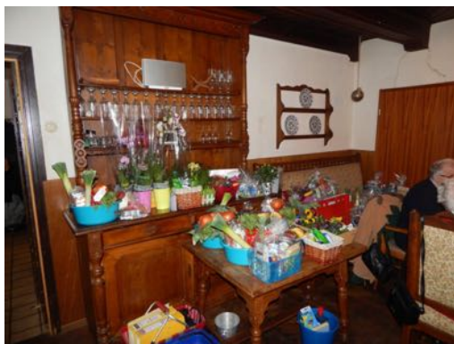
Präsente für die Tombola.