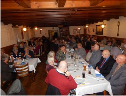
Erwartungsvoll im Saal.