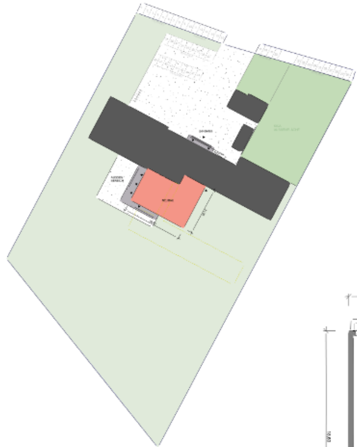
LAGEPLAN _ 1 : 500