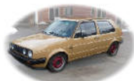
Das Rallye Auto (noch ohne Werbung)

http://balticrally.superlative-adventure.com