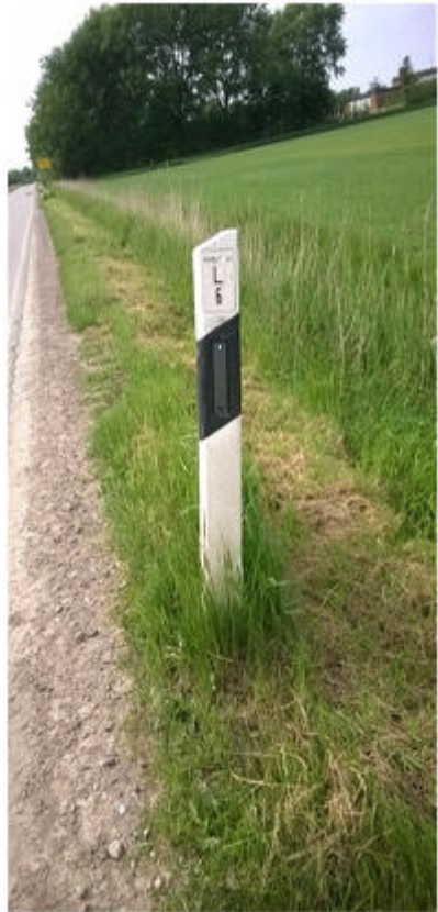
Ab- schnitt und Station an den Leitpfählen