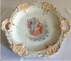
Kuchenteller, 5,00 €