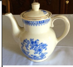
Kaffeekanne, 10,00 €