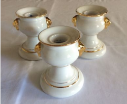
3 Kerzenhalter, 25,00 €