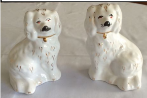
Hundepärchen, 5,00 €