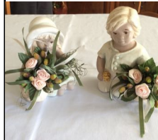
Dekofiguren, 8,00 €