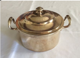
Versilberter Topf, 20,00 €