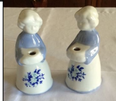
Kerzenhalter, 5,00 €